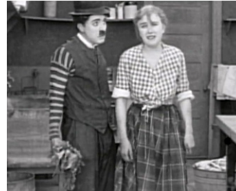
1918 LES AVATARS DE CHARLOT (Triple Trouble) de Charles Chaplin avec Edna Purviance