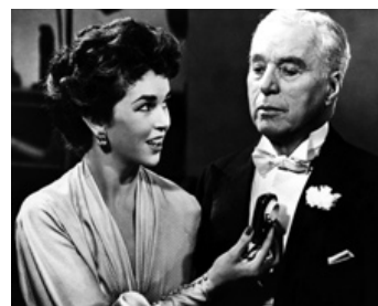
1957 UN ROI À NEW YORK (A King in New York) de Charles Chaplin avec Dawn Adams