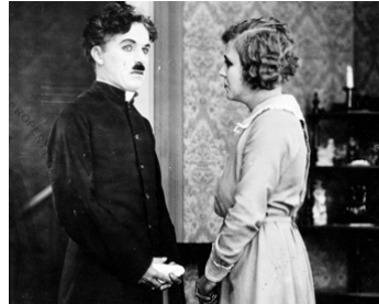
1923 LE PÈLERIN (The Pilgrim) de Charles Chaplin avec Edna Purviance