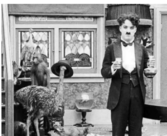
1916 CHARLOT RENTRE TARD (One A. M.) de Charles Chaplin