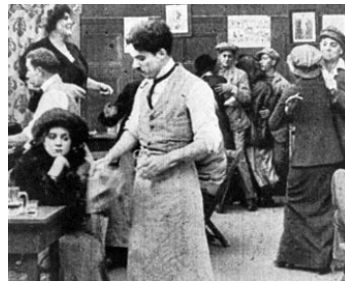
1914 CHARLOT GARÇON DE CAFÉ (Caught in a Cabaret) de et avec Mabel Normand