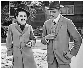
1914 POUR GAGNER SA VIE (Making a Living) d'Henry Lehrman avec Chester Conklin