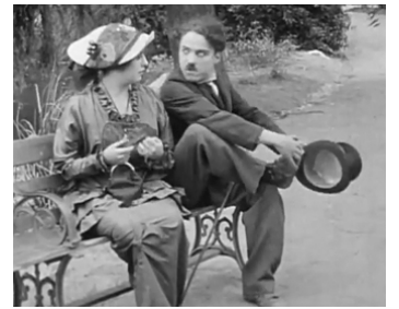
1914 CHARLOT ET MABEL EN MÉNAGE (Mabel's married lie) de Charles Chaplin avec M. Normand