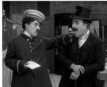
1915 CHARLOT À LA BANQUE (The Bank) de Charles Chaplin avec John Rand