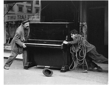
1914 CHARLOT DÉMÉNAGEUR (His musical Career) de Charles Chaplin avec Mack Swain