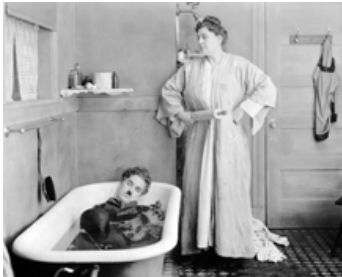
1922 JOUR DE PAYE (Pay Day) de Charles Chaplin avec Phyllis Allen