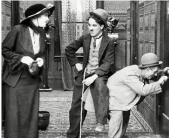
1915 CHARLOT FAIT LA NOCE (A Nice Out) de Ch. Chaplin avec E. Purviance, Ben Turpin