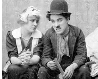
1915 CHARLOT APPRENTI (Work) de Charles Chaplin avec Edna Purviance