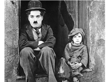
1921 LE GOSSE (The Kid) de Charles Chaplin avec Jackie Coogan