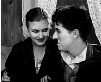
1919 UNE IDYLLE AUX CHAMPS (Sunnyside) de Charles Chaplin avec Edna Purviance