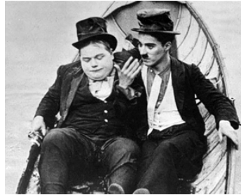
1914 CHARLOT ET FATTY FONT LA BOMBE (The Rounders) de Ch. Chaplin avec R. Arbuckle