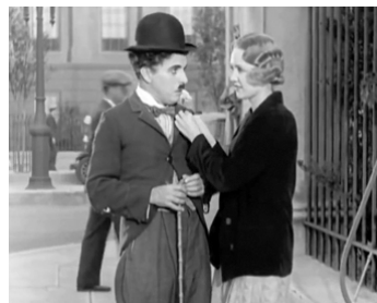
1931 LES LUMIÈRES DE LA VILLE (City Lights) de Charles Chaplin avec Virginia Cherrill