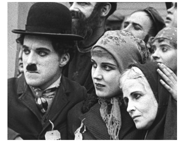
1917 L'ÉMIGRANT (The Immigrant) de Charles Chaplin avec Kitty Bradbury, E. Purviance