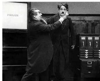
1916 CHARLOT CHEF DE RAYON (The Floorwalker) de Charles Chaplin avec Eric Campbell