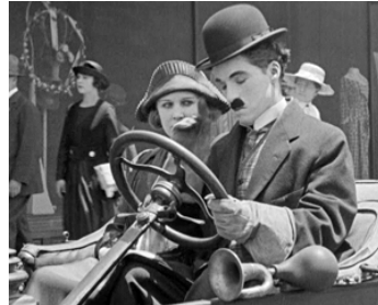
1919 UNE JOURNÉE DE PLAISIR (A Day's Pleasure) de Ch. Chaplin avec Edna Purviance