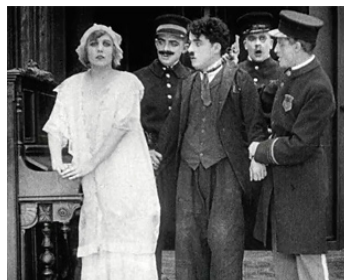
1916 CHARLOT CAMBRIOLEUR (Police) de Ch. Chaplin avec Edna Purviance, Leo White