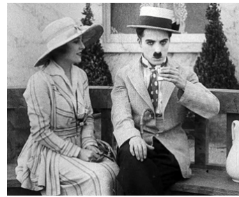
1917 CHARLOT FAIT UNE CURE (The Cure) de Charles Chaplin avec Edna Purviance