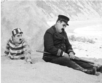
1917 CHARLOT S'ÉVADE (The Adventurer) de Charles Chaplin avec Eric Campbell