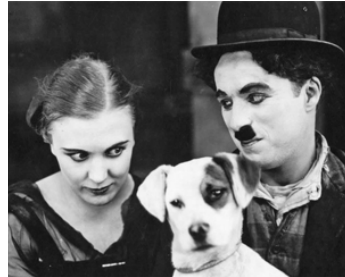
1918 UNE VIE DE CHIEN (A Dog's Life) de Charles Chaplin avec Edna Purviance