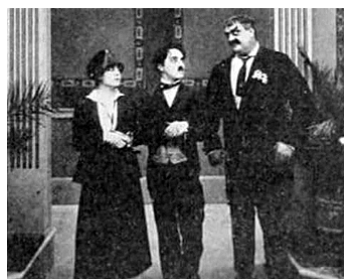
1916 CHARLOT PATINE (The Rink) de Charles Chaplin avec Edna Purviance, Eric Campbell