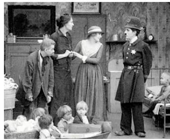
1917 CHARLOT POLICEMAN (Easy Street) de Ch. Chaplin avec Charlotte Mineau, E. Purviance