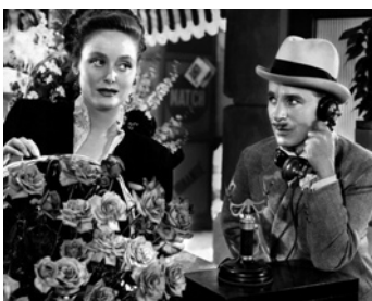
1946 MONSIEUR VERDOUX de Charles Chaplin avec Martha Raye