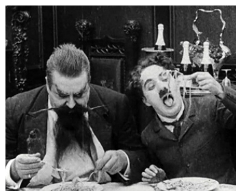
1916 CHARLOT ET LE COMTE (The Count) de Charles Chaplin avec Eric Campbell