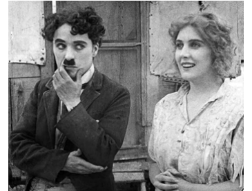
1915 LE VAGABOND (The Tramp) de Charles Chaplin avec Edna Purviance