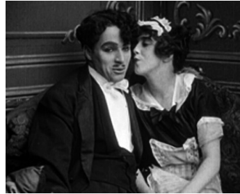
1914 LE ROMAN COMIQUE DE CHARLOT ET LOLOTTE de Ch. Chaplin avec Mabel Normand