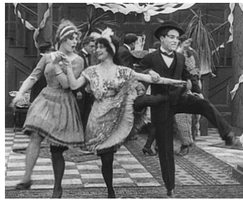
1914 CHARLOT DANSEUR (Tango Tangles) de Mack Sennett avec Minta Durfee