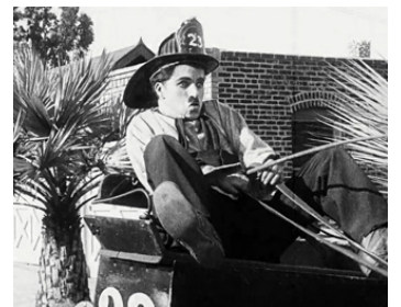
1916 CHARLOT POMPIER (The Fireman) de Charles Chaplin