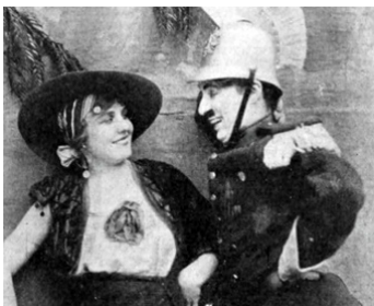
1915 CHARLOT JOUE CARMEN (Burlisque on Carmen) de Ch. Chaplin avec Edna Purviance