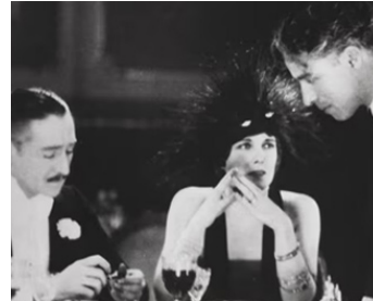
1923 L'OPINION PUBLIQUE (A Woman of Paris) de Ch. Chaplin avec A. Menjou, E. Purviance