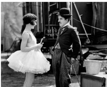
1927 LE CIRQUE (The Circus) de Charles Chaplin avec Merna Kennedy