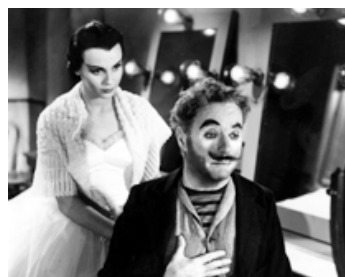
1952 LES FEUX DE LA RAMPE (Limelight) de Charles Chaplin avec Dawn Adams