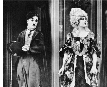
1921 CHARLOT ET LE MASQUE DE FER (The Idle Class) de Ch. Chaplin avec Edna Purviance