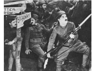
1918 CHARLOT SOLDAT (Shoulder Arms) de Charles Chaplin