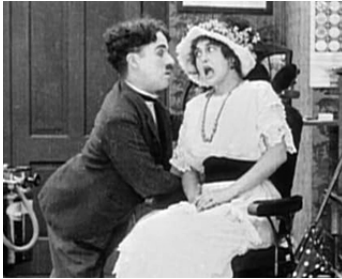
1914 CHARLOT DENTISTE (Laughin Gass) de Charles Chaplin avec Helen Carruthers