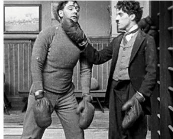
1915 CHARLOT BOXEUR (The Champion) de Charles Chaplin avec Leo White