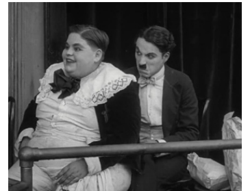
1915 CHARLOT AU MUSIC-HALL (A Night in the Show) de Charles Chaplin avec Dee Lampton