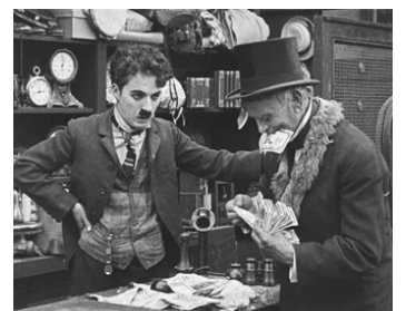
1916 CHARLOT BROCANTEUR (The Pawnshop) de Charles Chaplin avec Wesley Ruggles