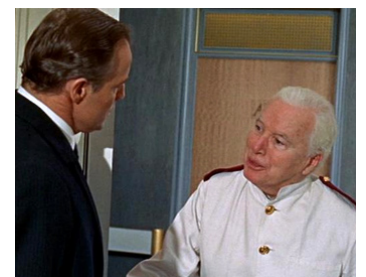
1966 LA COMTESSE DE HONG KONG (A Countess from Hong Kong) de C. Chaplin avec M. Brando