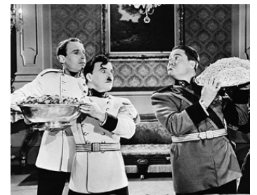
1940 LE DICTATEUR (The Great Dictator) de Ch. Chaplin avec Henry Daniell, Jack Oakie