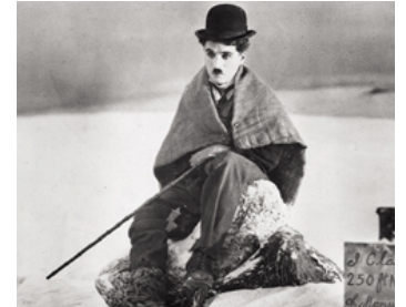
1925 LA RUÉE VERS L'OR (The Gold Rush) de Charles Chaplin