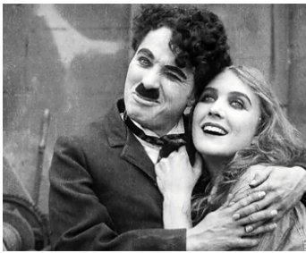
1916 CHARLOT FAIT DU CINÉ (Behind the Screen) de Charles Chaplin avec Edna Purviance